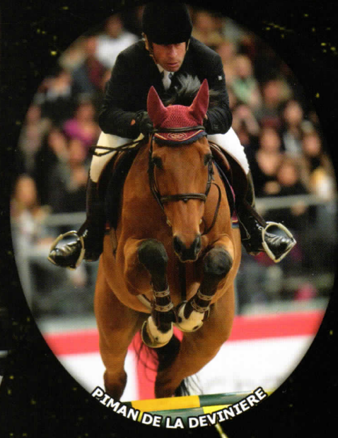
PIMAN DE LA DEVINIERE