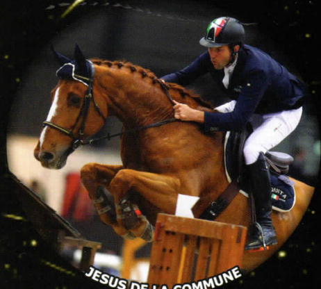
JESUS DE LA COMMUNE