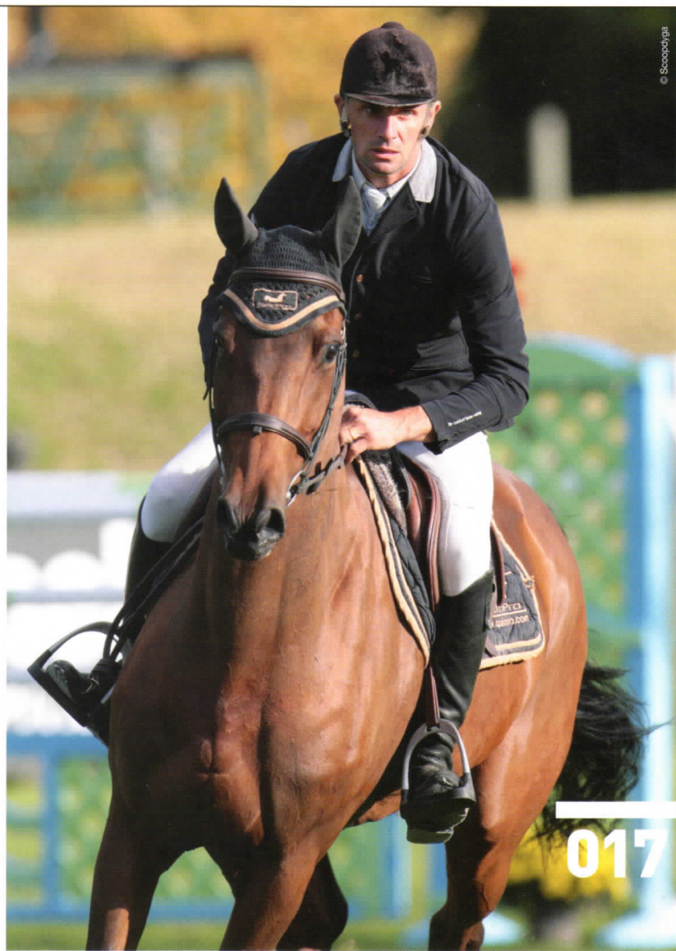
Ci-dessus : Kho de Presle, révélée par Jérôme Hurel, a été l'une des premières à valoriser les qualités de père de Diamant de Semilly, avant d'être vendue à l'Américaine Georgina Bloomberg. En bas : Kalaska de Semilly, champion des quatre ans à Fontainebleau, a ensuite accompagné la Sheikha Latifa Al Maktoum dans les plus grands événements, notamment les Jeux équestres mondiaux de Lexington, en 2010.

De plus, alors que beaucoup de très bons chevaux ont émergé de sa production, on attend encore le ou les cracks qui égaleront les performances paternelles. On voit certes de plus en plus ses fils et filles sur le circuit international, mais très peu ont été performants au très haut niveau et y sont restés.