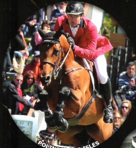
POLINSKA DES ISLES