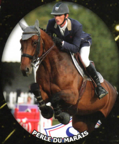
PERLE DU MARAIS